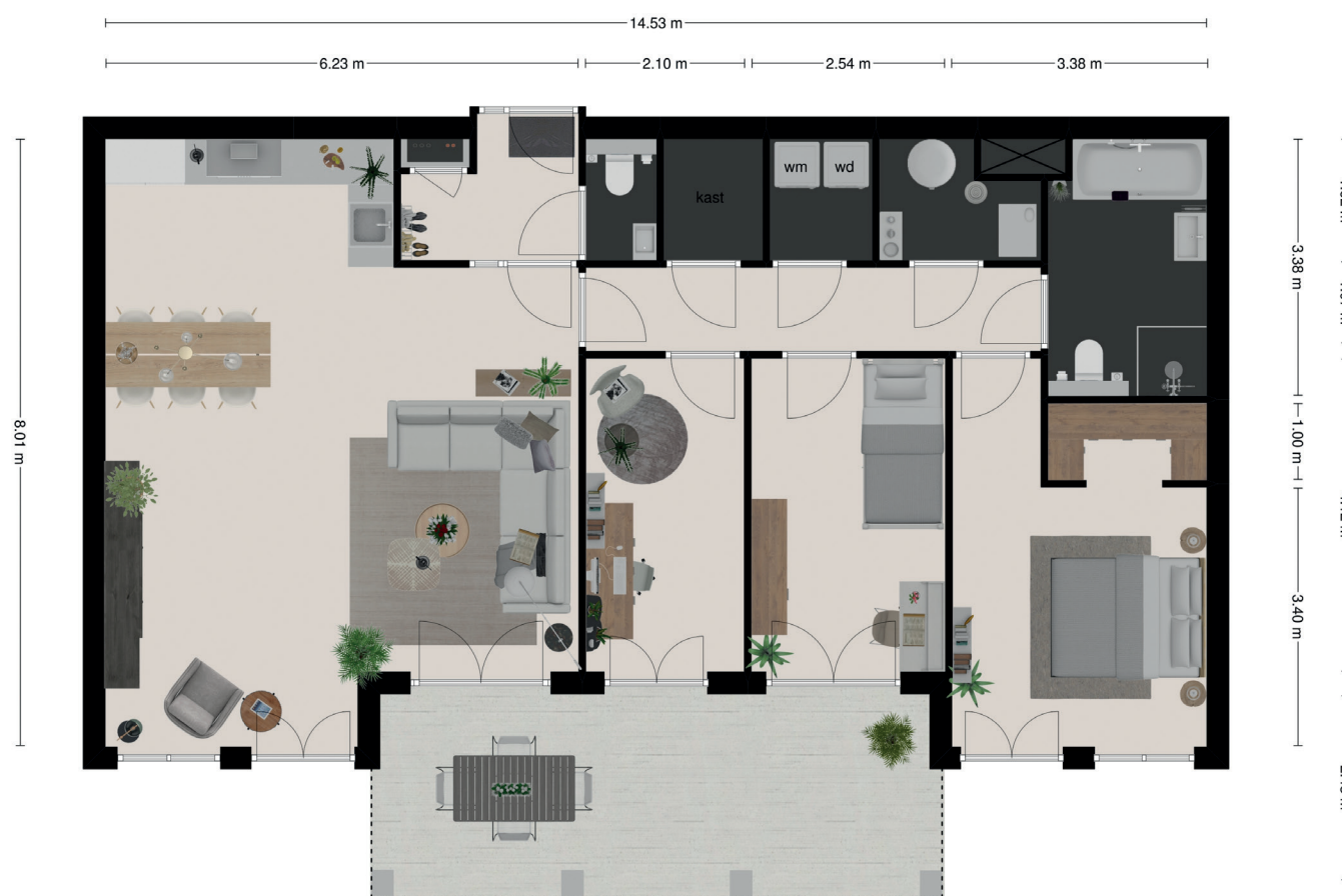
TYPE D | ZUIDERPAVILJOEN 1e verdieping